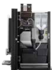
OPTIBEAN 3 (XL) TOUCH