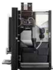
OPTIBEAN 2 (XL) TOUCH