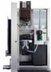
OPTIBEAN 3 (XL)