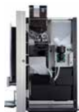
OPTIBEAN 2 (XL)