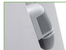
Specjalny zawias z wychyleniem