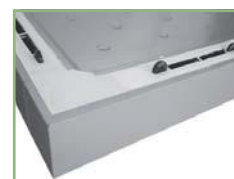
Perfekcyjne dopasowanie paneli

O2 - Komory chłodnicze i mroźnicze to rezultat długich doświadczeń producenta w branży chłodniczej. Dwie wersje chłodzenia - "plusówka" i "minusówka", wykonane są z paneli izolacyjnych o grubości 80 mm, pozwalających na złożenie 37 różnych kompozycji. Zaletą jest możliwość zamiany miejscami panela z agregatem chłodniczym z panelem z drzwiami. Przy wysokości 2110 mm, pojemności robocze komór zamykają się w przedziale od 2,10m 3 do 12,63m 3 . Komory chłodnicze i mroźnicze to idealne rozwiązanie do przechowywania dużych ilości zapasów.