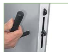
Klucz do scalania paneli