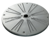
twardy ser, czekolada, orzechy